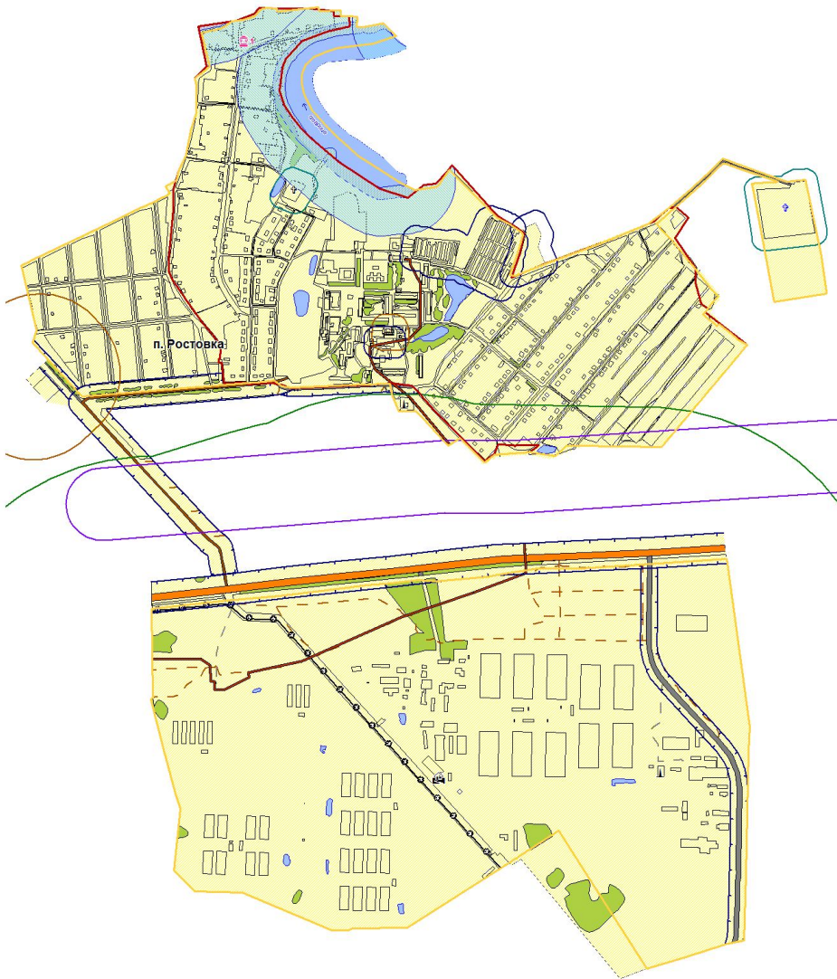
Схема границ Ростовкинского сельского поселения