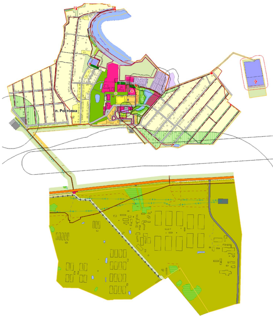
Схема границ Ростовкинского сельского поселения Масштаб 1:10 000