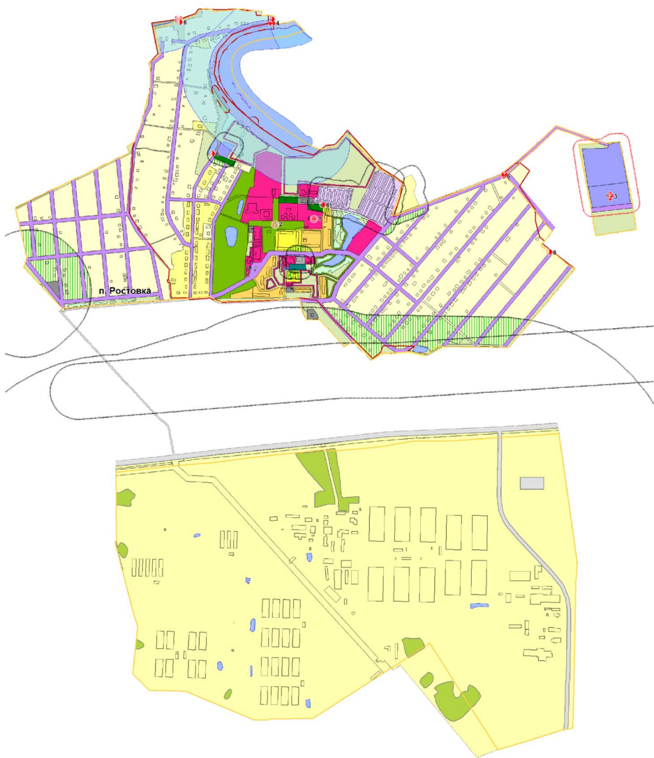
Схема границ Ростовкинского сельского поселения Масштаб 1:10 000